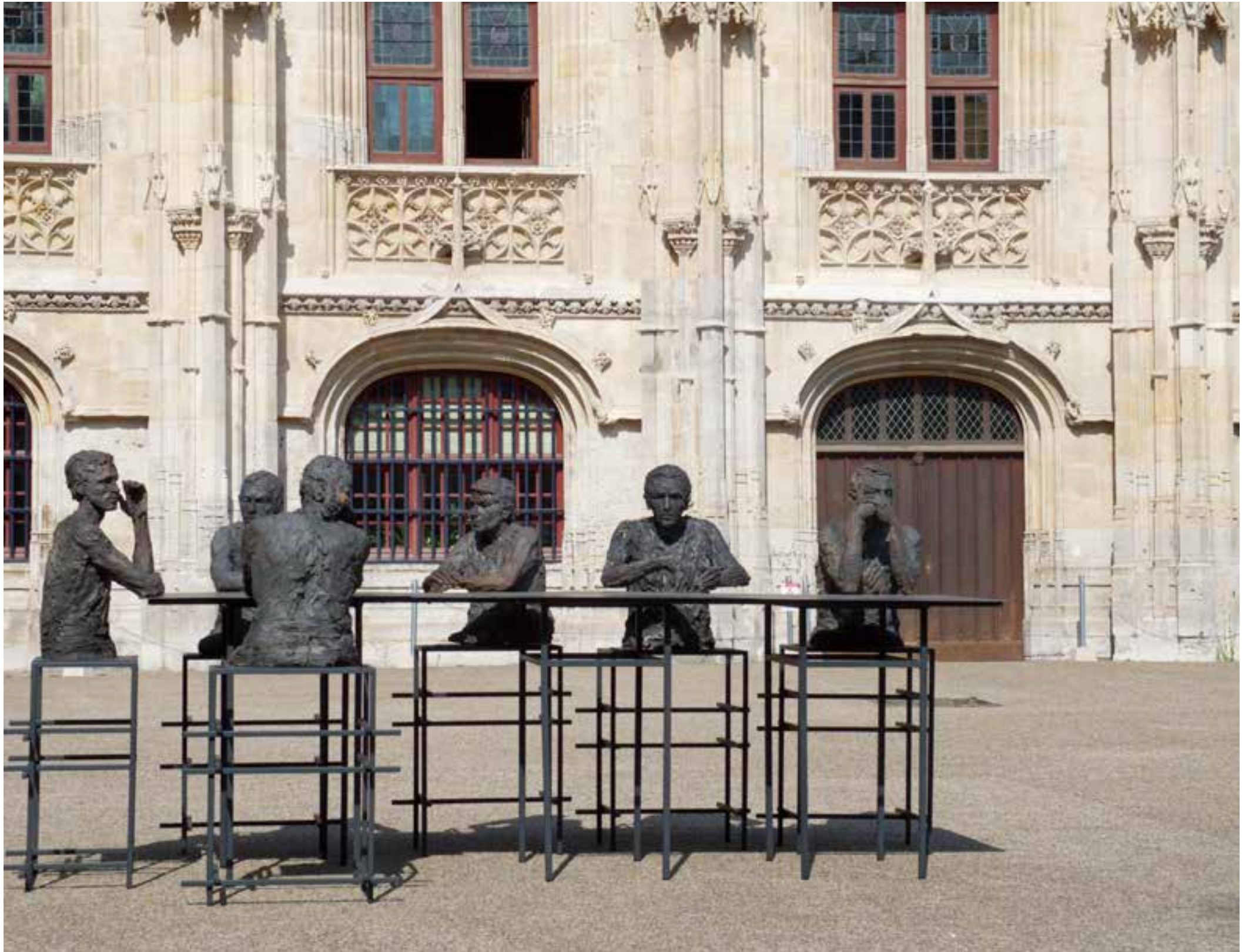
Persona, ae - Cour d'appel de Rouen, exposition « Travers/ées », 2014.