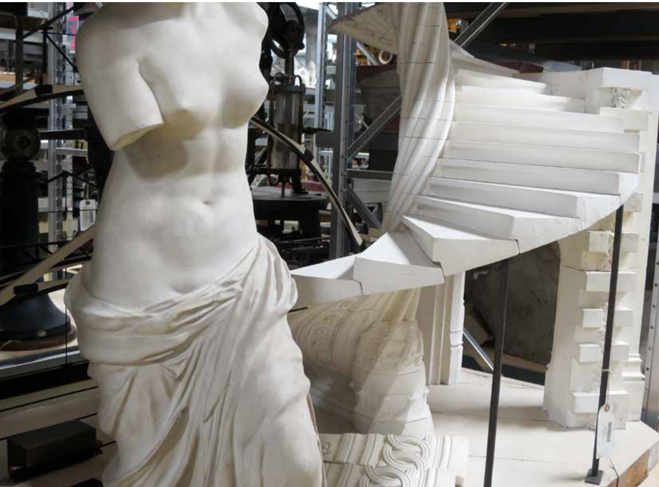
Vénus en béton dans les réserves, 2017.