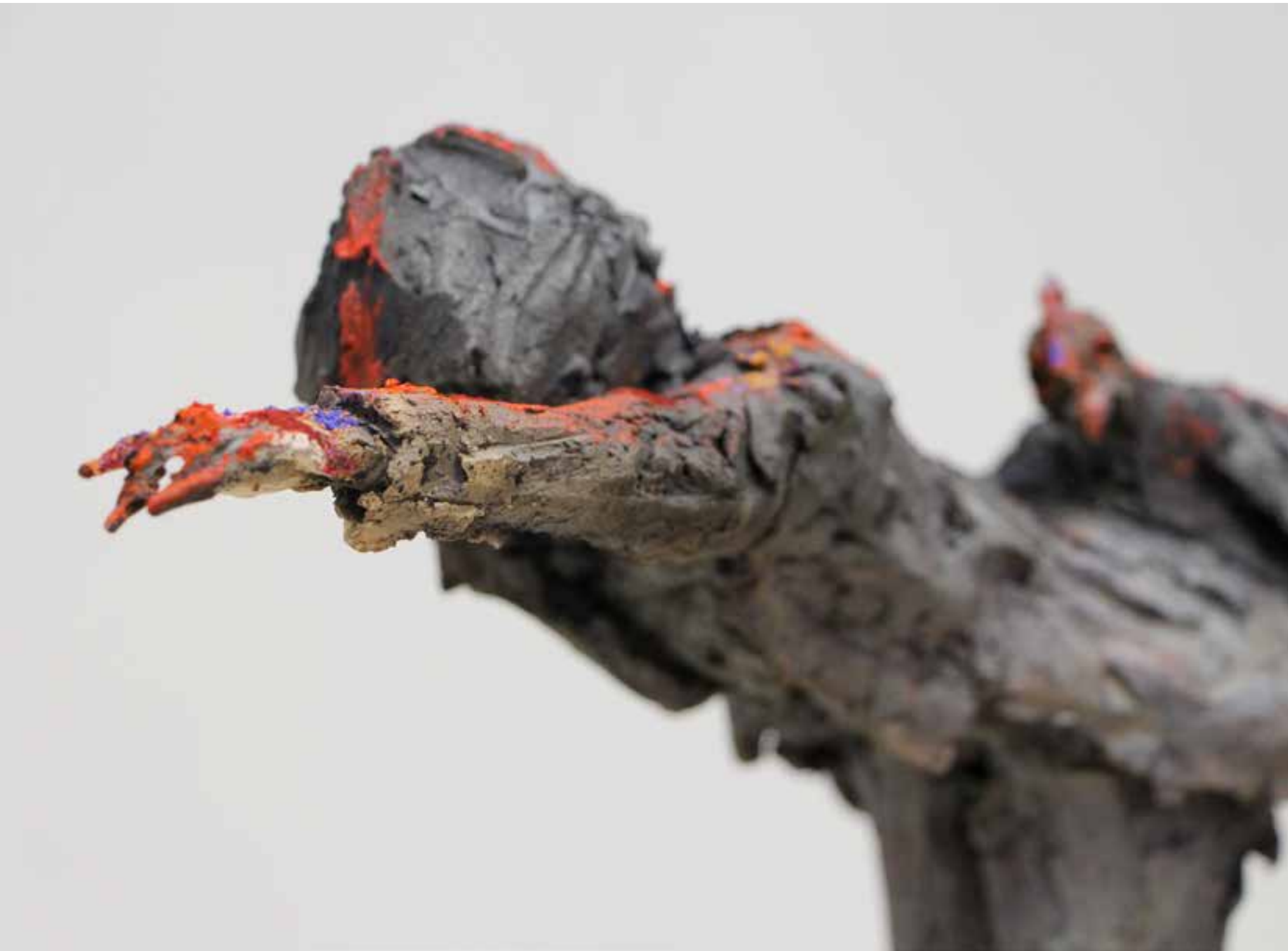
Oiseuse - 2018.