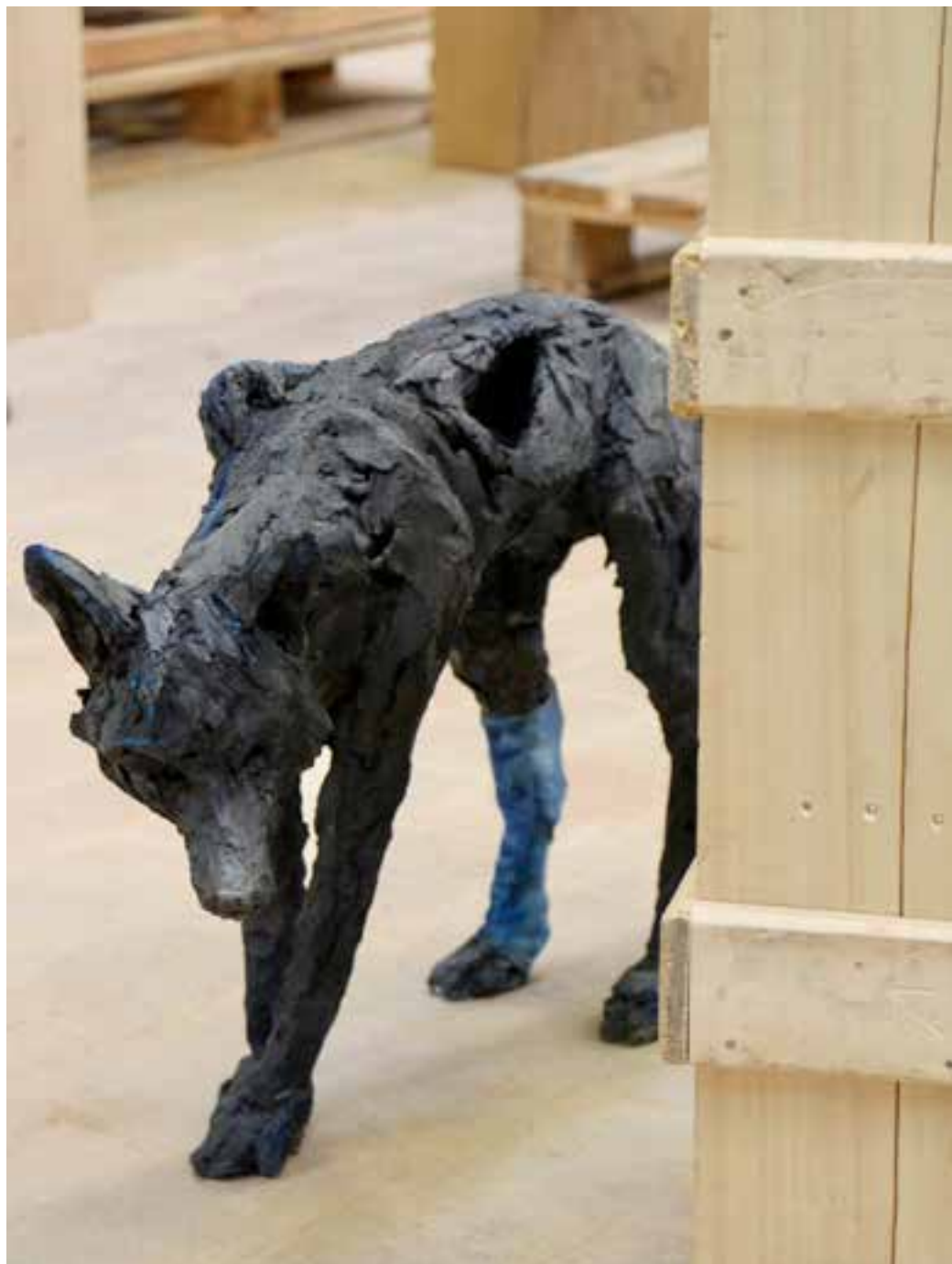
↑ → Montage de l'exposition « Petites histoires en réserve », en atelier à Bolbec, 2018.