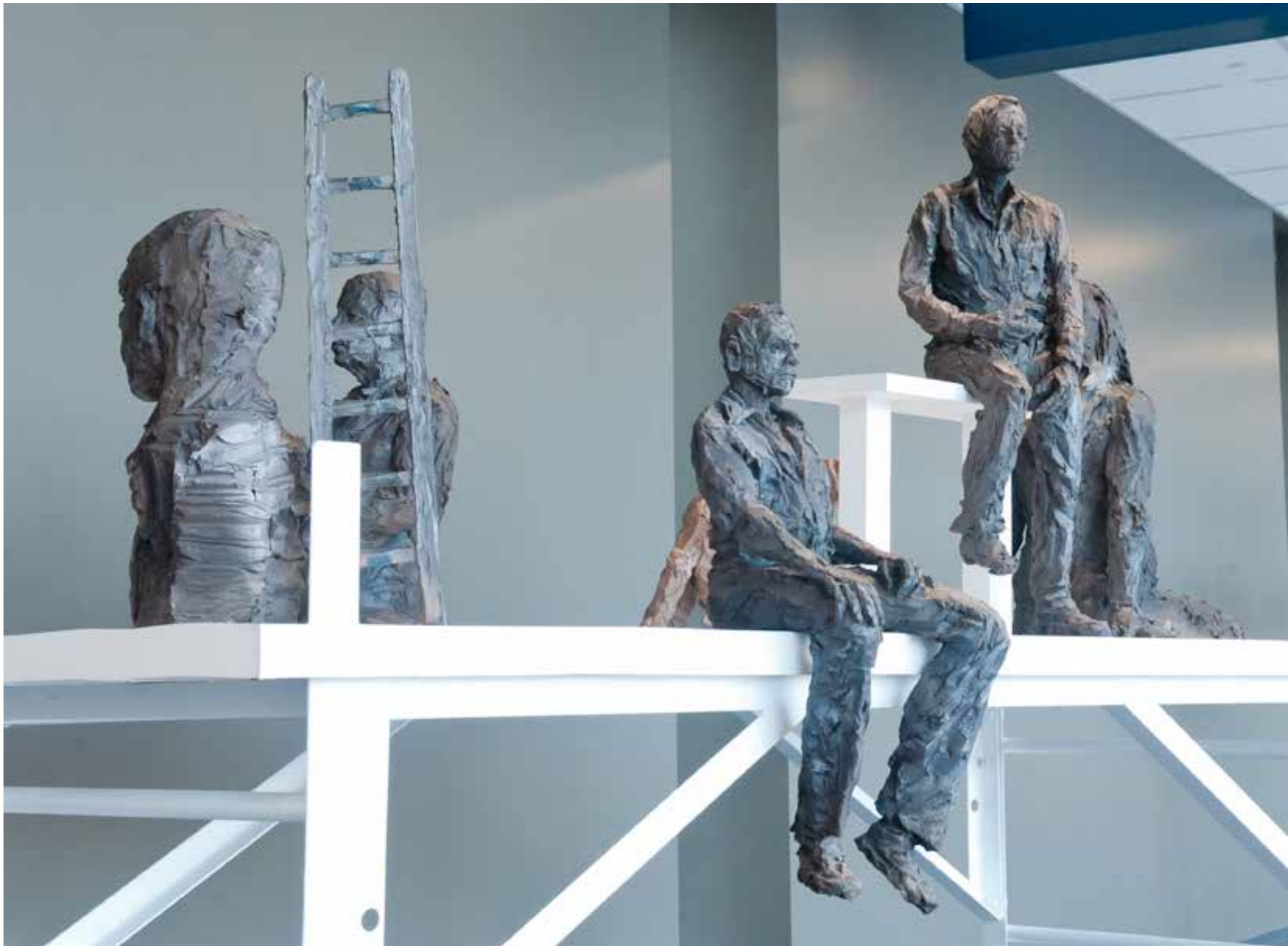
Tant que tournent les roues... (détail) - 2015 (coll. CHU de Montréal).