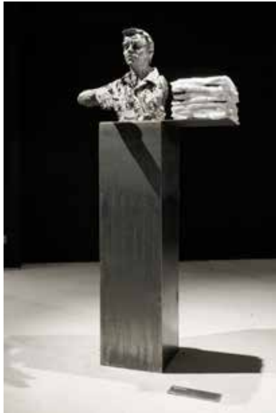
↑ Solo blanc (avec Pierre-Yves) - Docks du Havre, 2013.

La mer ils ne la voient plus, mais ils se distinguent des terriens avec fierté. Se nommer marin c'est se couvrir d'écailles et de sel plutôt que de plumes et de poussière, c'est se vivre par l'aventure encore possible, la solitude encore choisie, en dépit des déshumanisations portuaires et mondialisées. L'humilité et la résistance des marins sont une arme de survie.