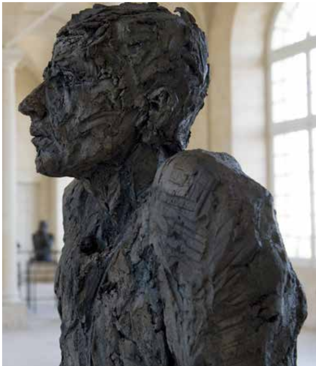
↑ → So Sorry (avec Gildas) - Abbaye aux Dames, Caen, 2010. Cour d'appel de Caen, 2012 (coll. publique).

pour moi à ne plus savoir penser grand-chose du crime et du châtement. Gibran dit que l'assassiné n'est pas innocent de son assassinat. Badinter dit qu'un homme se défend du fait de son humanité, quelle que soit l'ampleur de la violence et de la barbarie. »