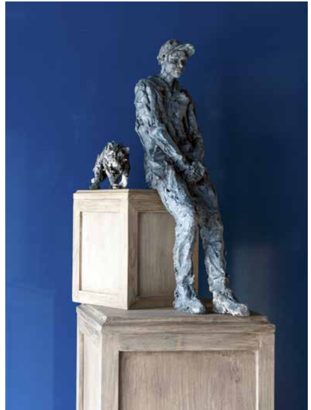
Rêve de loup (avec Gabriel-le) - 2015.