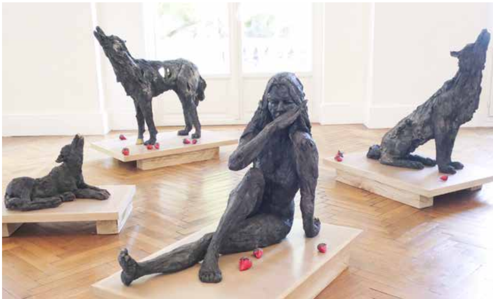
↑ → Les Louves (avec Linda) - Château des Terrasses, Cap-d'Ail, exposition « Des bêtes en ce château », 2016.