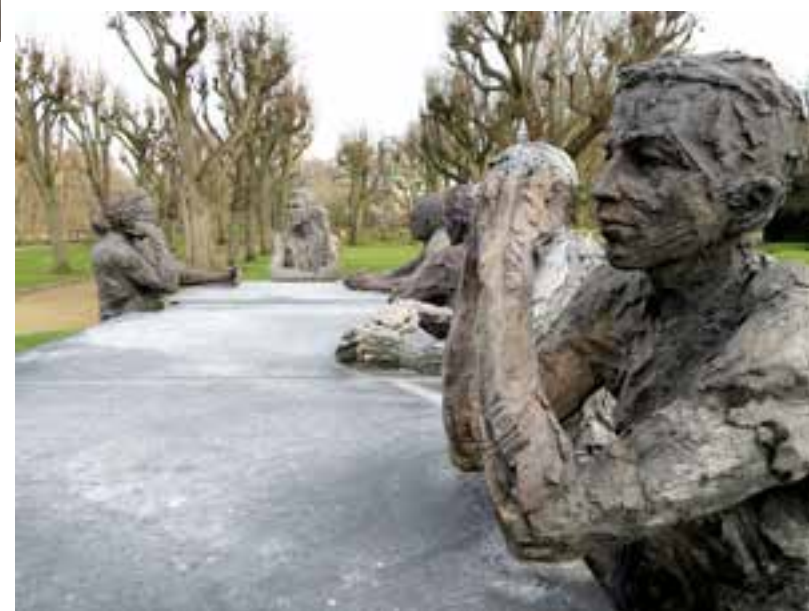
→ Persona, ae (détail) - Jardin des sculptures, La Celle-Saint-Cloud, 2017.