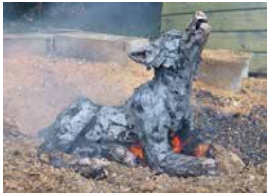
↑ Louveteau - 2016 (coll. particulière).

C. R. : Oui, et c'est très intime, iridescent, sans fond, la mémoire de l'enfance. Ce récit aboutit à la série en cours sur le secret et autour du secret, son poids. J'ai construit de grands silences entre hommes et bêtes. Rien n'est raconté mais quelque chose vient suggérer la menace, l'enveloppe, la béquille... et l'imprudente tendresse.