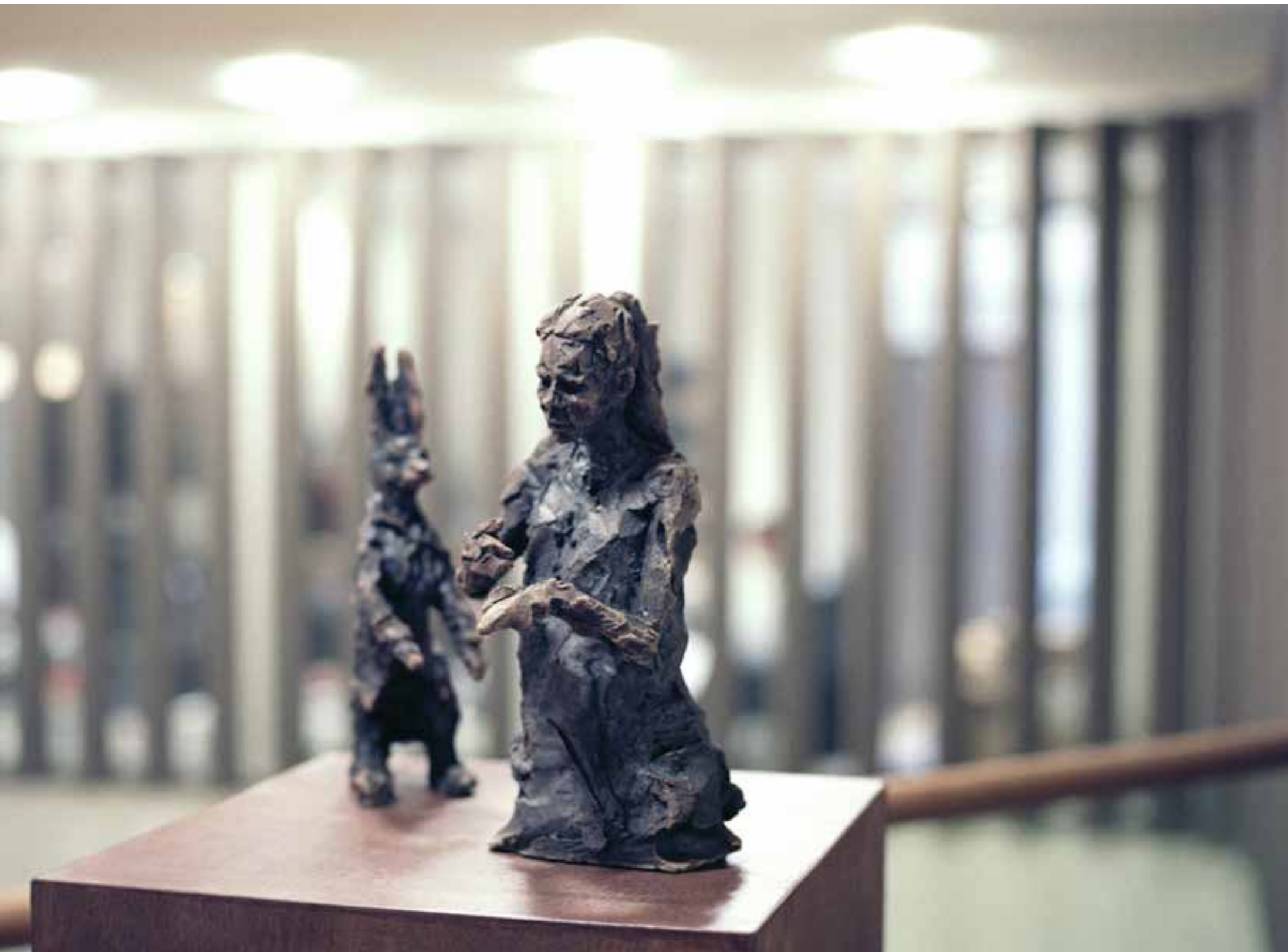
Du temps au temps - Fondation OFI, 2016.