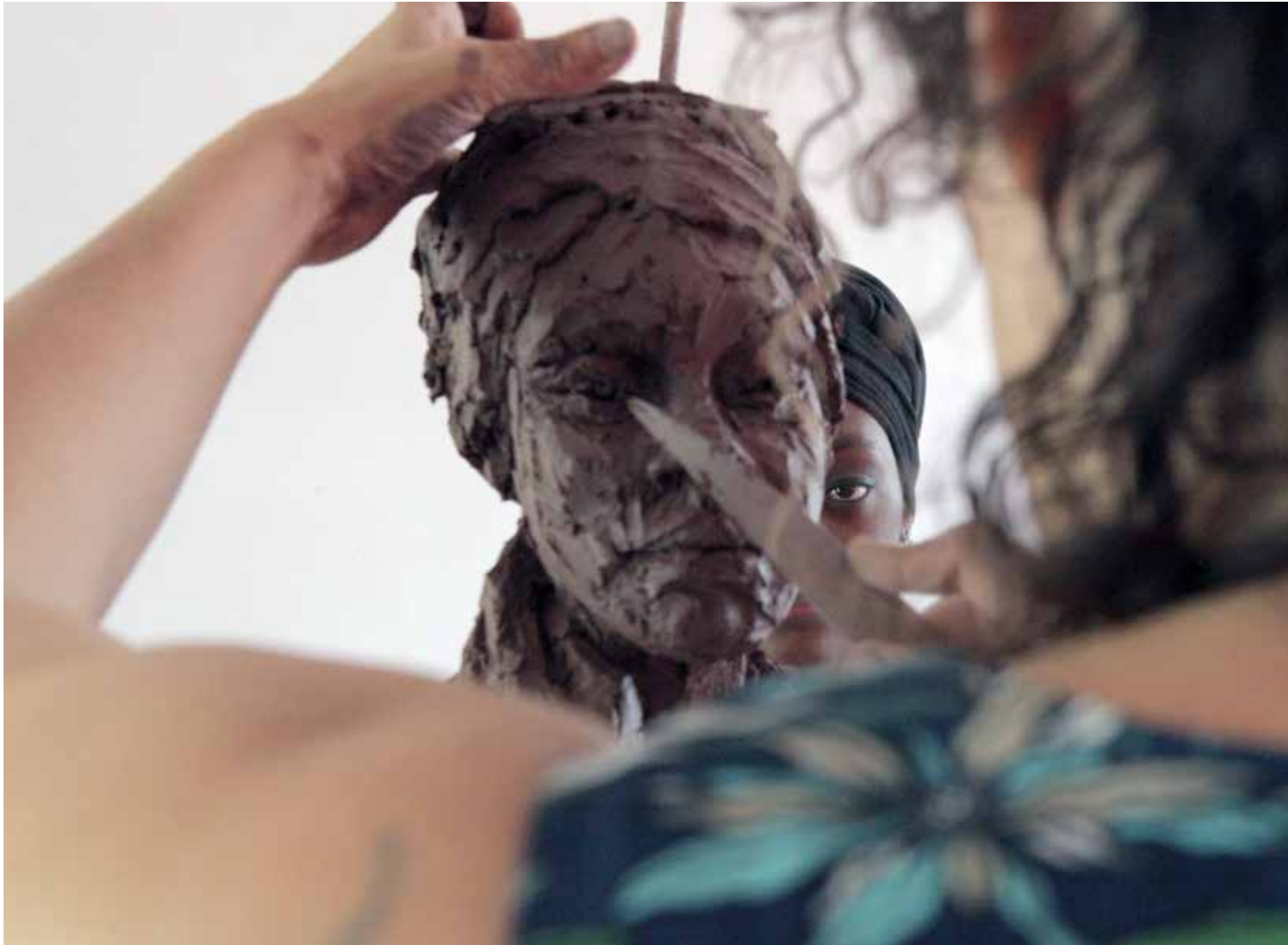
Avec Moussou, 2017.