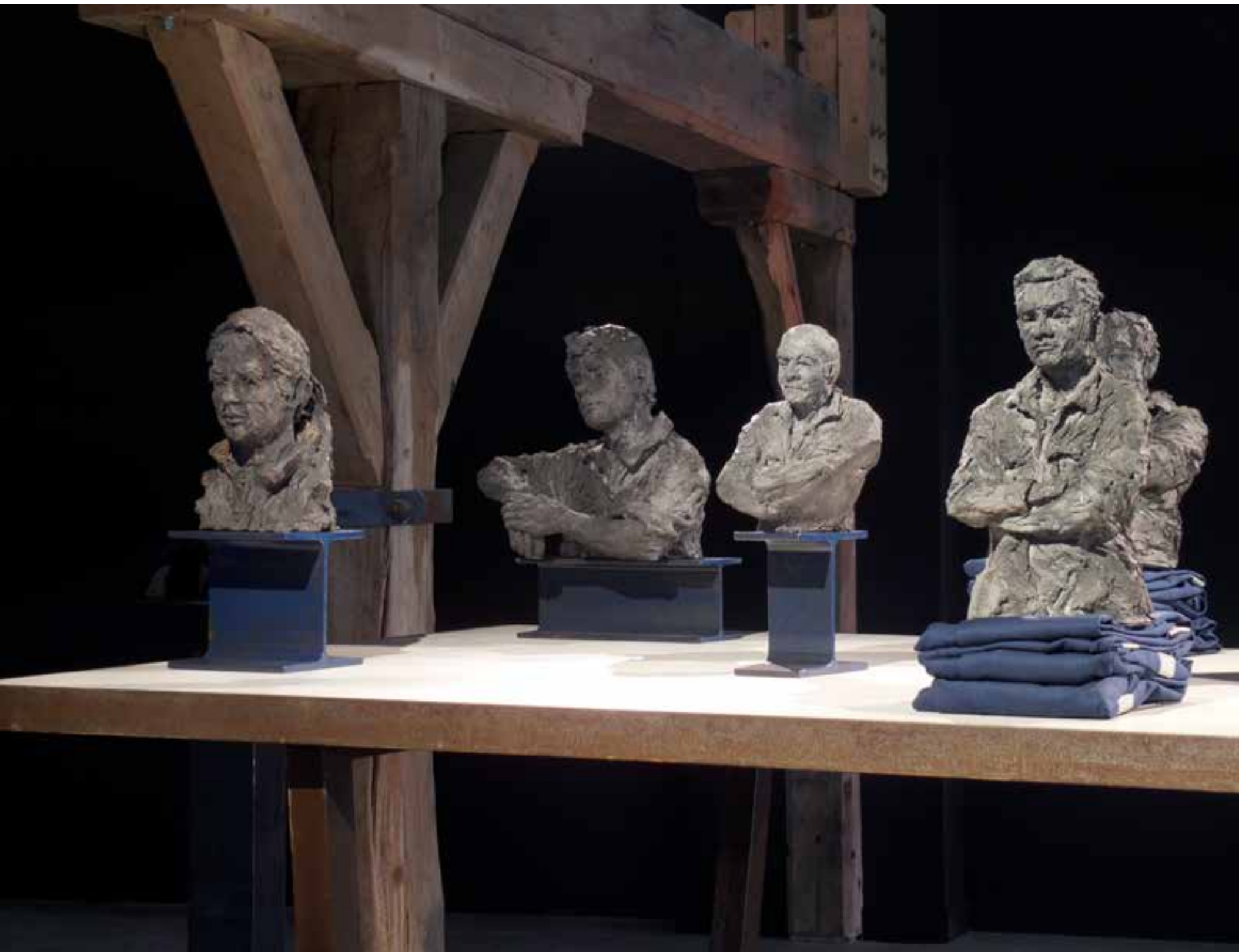
Hommes d'équipage (détails).