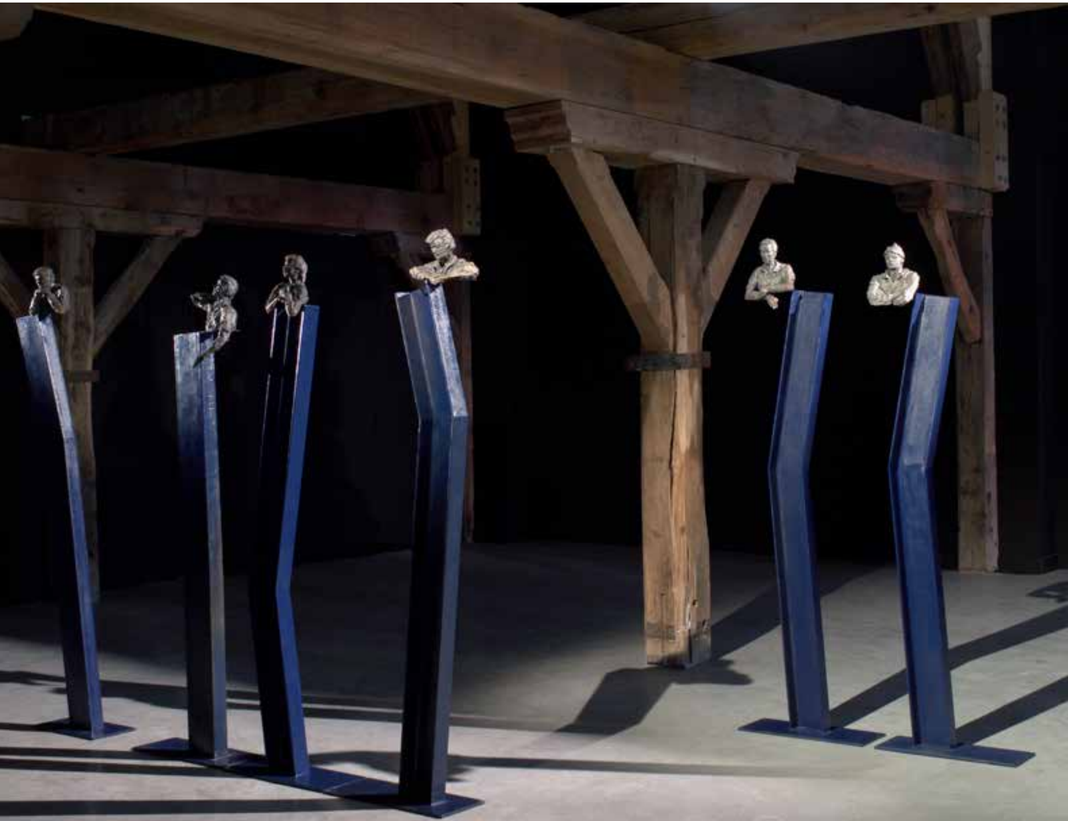
OFW's (overseas filipino worker's).