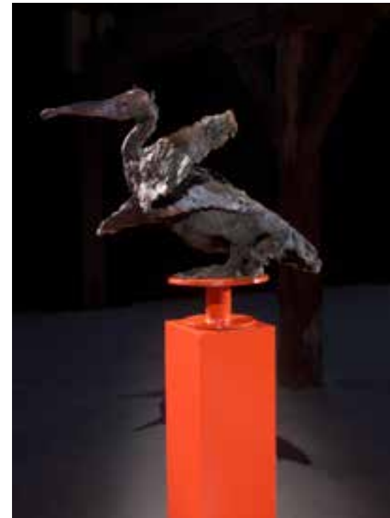
↑ Oiseau - 2013.

ça s'écrase ; le matelas, le corps, le sol, tout est bateau, tout est la vague qui se casse à l'avant, tout est la crête blanche qui s'effondre dans des nappes d'écume ; tout est la vague qui monte et enfle et explose avant de s'enrouler sur elle-même et de s'étaler dans un creux énorme ; ça vibre et ça souffle, la machine imperturbable à dix-sept nœuds, ça vibre et là-haut, à la passerelle, veillent deux hommes pour le quart du chien ; temps de chien ne se dit pas en mer et pourtant là, nuit de chien, esprit errant ; m'habiller, monter